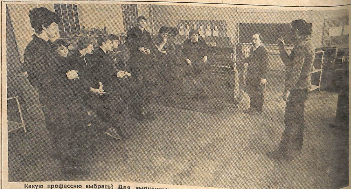
Какую профессию выбрать? Для выпускников нет сегодня важнее вопроса. Помогают им выбрать профессию экскурсии на предприятия, встречи с рабочими. На снимке: встреча выпускников УПУ с молодыми рабочими цеха № 18.